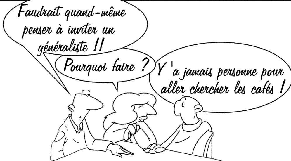
Plate-forme de concertation en santé mentale

se modifier par la pratique du partenariat :