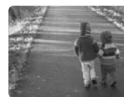
La santé de l'enfant, approche multidimensionnelle

diagnostic à faire et l'on ne connaît des familles que leurs prénoms et l'âge des enfants. La confiance est importante. Le travail réside en un échange, une réflexion, avec les parents sur leur rôle, sur l'éducation, sur la société. « On ne naît pas parent, on le devient », il n'y a pas d'école non plus pour apprendre le métier de parent, c'est dans la pratique du quotidien, dans le contact et l'observation de son enfant que le parent apprend.