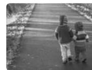
La santé de l'enfant, approche multidimensionnelle