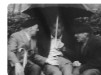
parapluie ou porte-voix ?

Plusieurs observations me semblent intéressantes à ramener ici.