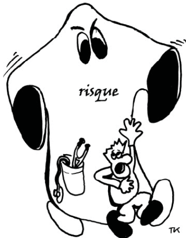
Figure 2 : Aider le patient à gérer l'incertitude ?

d'un facteur de risque. Il ne faut pas effrayer nos patients en leur faisant prendre conscience que la vie est en soi un facteur de risque de décès, alors qu'en fait il s'agit d'une prédisposition à la mort (Figure 2).