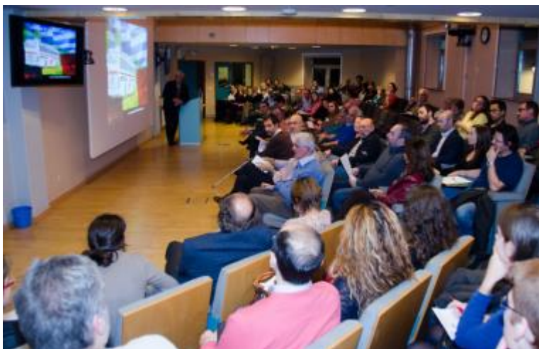
L'auditoire Bastenie du CHU Saint-Pierre occupé par un élan de solidarité.

Le forum « Solidarité médicale avec la population grecque » du CHU Saint-Pierre a réuni jeudi dernier près de 100 participants. L'échange de vues a déjà permis d'élaborer des projets locaux, pour venir en aide aux soignants et aux patients de la péninsule hellénique.