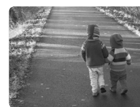
La santé de l'enfant, approche multidimensionnelle

sociale de première ligne qui soit d'accès universel, et de la compléter, en cascade, par des approches innovantes, holistiques et pluridisciplinaires. En outre, il est souhaitable de renforcer l'information sur l'offre périnatale et la formation continue pour réfléchir et agir collectivement à propos de situations complexes dans une approche non stigmatisante qui soit fondée sur l' empowerment . ●