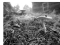
le terreau des maisons médicales