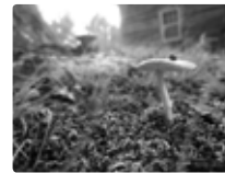
le terreau des maisons médicales