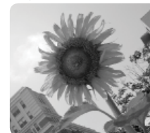
Développement de la qualité