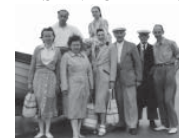
SOCIALES DE SANTÉ

tivité et l'efficacité des différentes interventions, tandis que l'approche britannique semble plus directement opérationnelle : cherchant une concrétisation rapide, les politiques mises en oeuvre ont été définies sur la base de recommandations établies à partir des connaissances sur les déterminants et l'efficacité des interventions ;