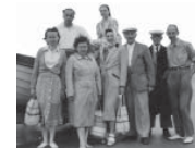
SOCIALES DE SANTÉ